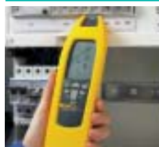
Определение местонахождения предохранителей/прерывателей и привязка к цепям