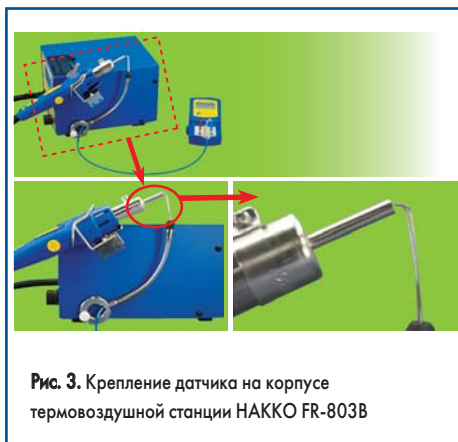
Рис. 3. Крепление датчика на корпусе термовоздушной станции НАККО FR-803В

Датчик при измерении горячего воздуха у сопла головки (термометр FG-100 и термовоздушная станция НАККО FR-803В), в зависимости от применяемого оборудования, за-