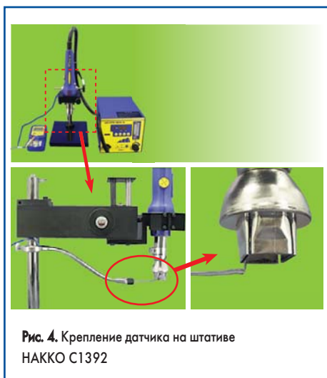
Рис. 4. Крепление датчика на штативе НАККО С1392

крепляется или на корпусе термовоздушной станции (рис. 3), или на штативе (рис. 4).