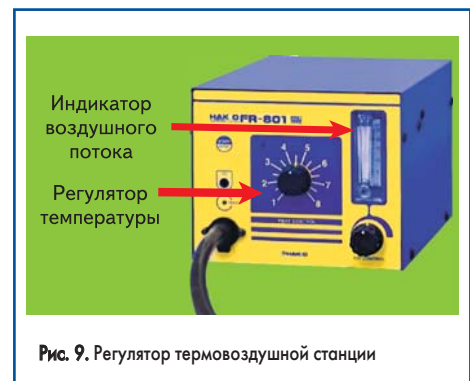
Рис. 9. Регулятор термовоздушной станции

С помощью регуляторов термовоздушной станции (температура и поток) устанавливаются тепловой режим, соответствующий безопасной для компонента температуре, но позволяющий быстро и качественно произвести пайку (рис. 9).