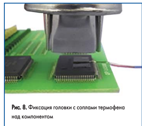
Рис. 8. Фиксация головки с соплами термофена над компонентом

и фиксируется на нем (рис. 8). Температура горячего воздуха варьируется в зависимости от расстояния между головкой и компонентом, окружающей среды, температуры помещения и т. д. Режим работы следует устанавливать с учетом реальных условий окружающей среды, например наличия кондиционера.