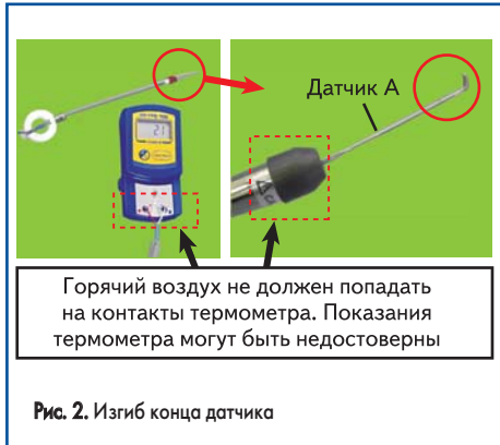
Рис. 2. Изгиб конца датчика

1. Необходимо изогнуть конец датчика, как показано на рис. 2.