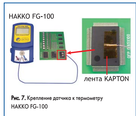
Рис. 7. Крепление датчика к термометру НАККО FG-100

На термофене станции НАККО FR-801 устанавливается головка с соплами, соответствующими применяемому компоненту,