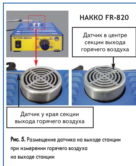
Рис. 5. Размещение датчика на выходе станции при измерении горячего воздуха на выходе станции

При измерении горячего воздуха на выходе станции предварительного разогрева (термовоздушная станция НАККО FR-820) датчик поочередно помещается в центр секции выхода горячего воздуха и к ее краю (рис. 5), его необходимо также размещать на расстоянии 1–2 мм от выхода.